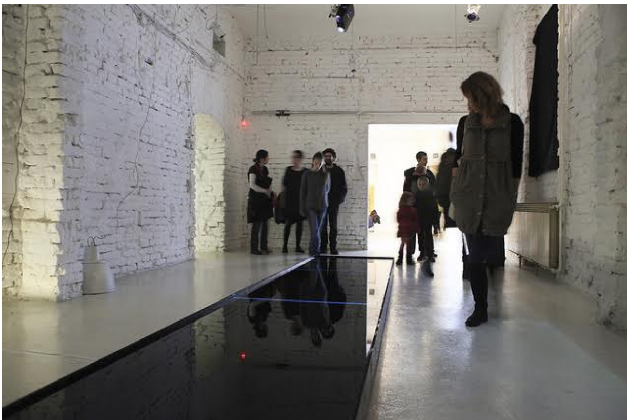
Liquid Light, HUB, Beograd

Kad kao umetnik predložim da recimo potopim neku galeriju, to se može ispostaviti kao problem. Zato vrebam priliku. Nisam u žurbi. Kao što je bilo u Grčkoj, slično sam radio u jednoj napuštenoj crkvi u Češkoj. Uz strpljenje, može se pronaći odgovarajući prostor. Zadovoljan sam i ako samo po nekad mogu da postavim takve instalacije. Uvek im dodam nešto novo ili je promenim, prilagodim prostoru. Bilo bi mi dosadno da je uvek isto. Nemam holistički odnos prema radu. Radi se o procesu i svaki put može biti drugačije. Komunikacija sa umetničkim radom je vrlo bitna. Voleo bih da shvatim šta se dešava u odnosu između tela, šta je dijalog, šta se dešava između dvoje ljudi koji komuniciraju, između gledaoca i rada koji posmatra, umetnika i rada, šta se dešava kad napravimo zajednicu, šta je to što nas povezuje? Možda je i to razlog zašto se bavim interaktivnim instalacijama jer mogu direktno da posmatram kako publika reaguje na rad.